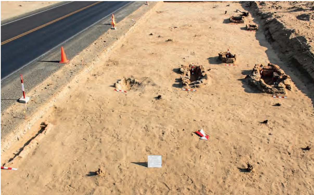
Figura 5. Conjunto de estructuras de combustión registradas en la Unidad V del Sector A, construidas directamente sobre la arena estéril.

Muchas de estas estructuras estuvieron dispuestas junto a, o en las inmediaciones de, los troncos de árboles quemados, por lo que tal disposición se debe, probablemente, al fácil acceso de combustible recientemente obtenido (Figura 7).