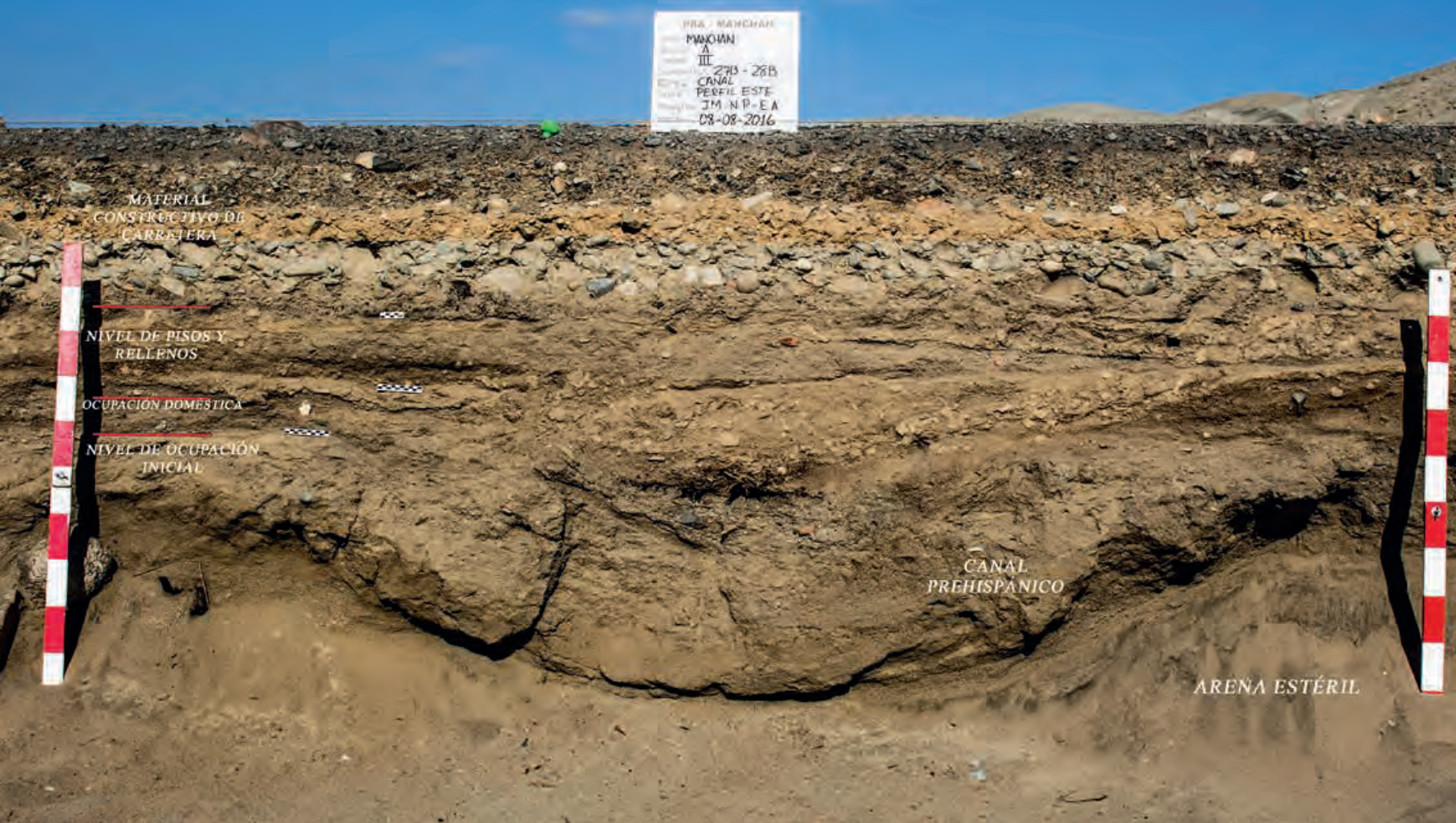
Figura 21. Perfil este, Unidad III del Sector A. Representa con mejor detalle la superposición de eventos culturales ocurridos durante la ocupación de Manchán dentro del Conjunto 1.