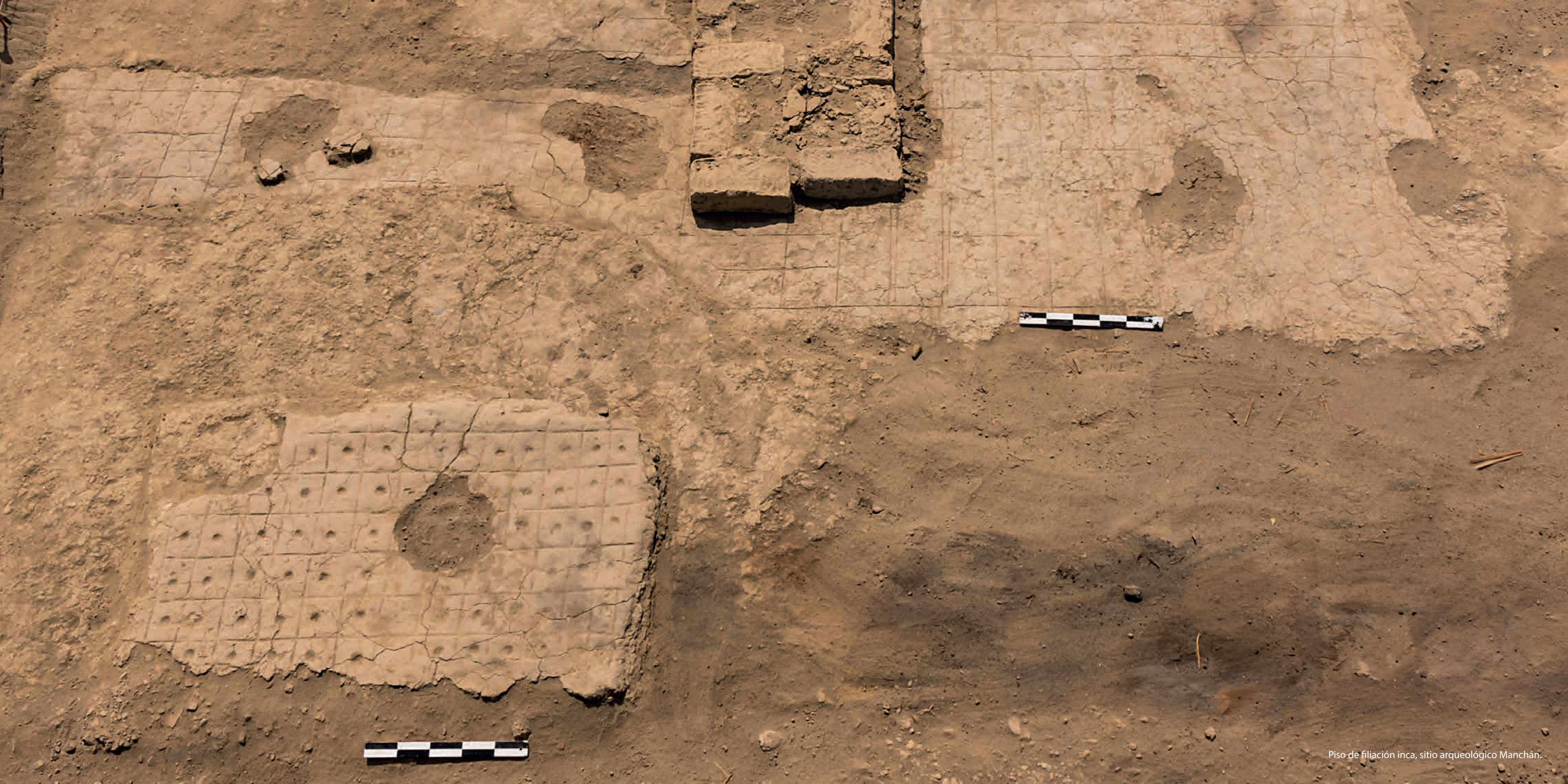
Piso de filiación inca, sitio arqueológico Manchán.