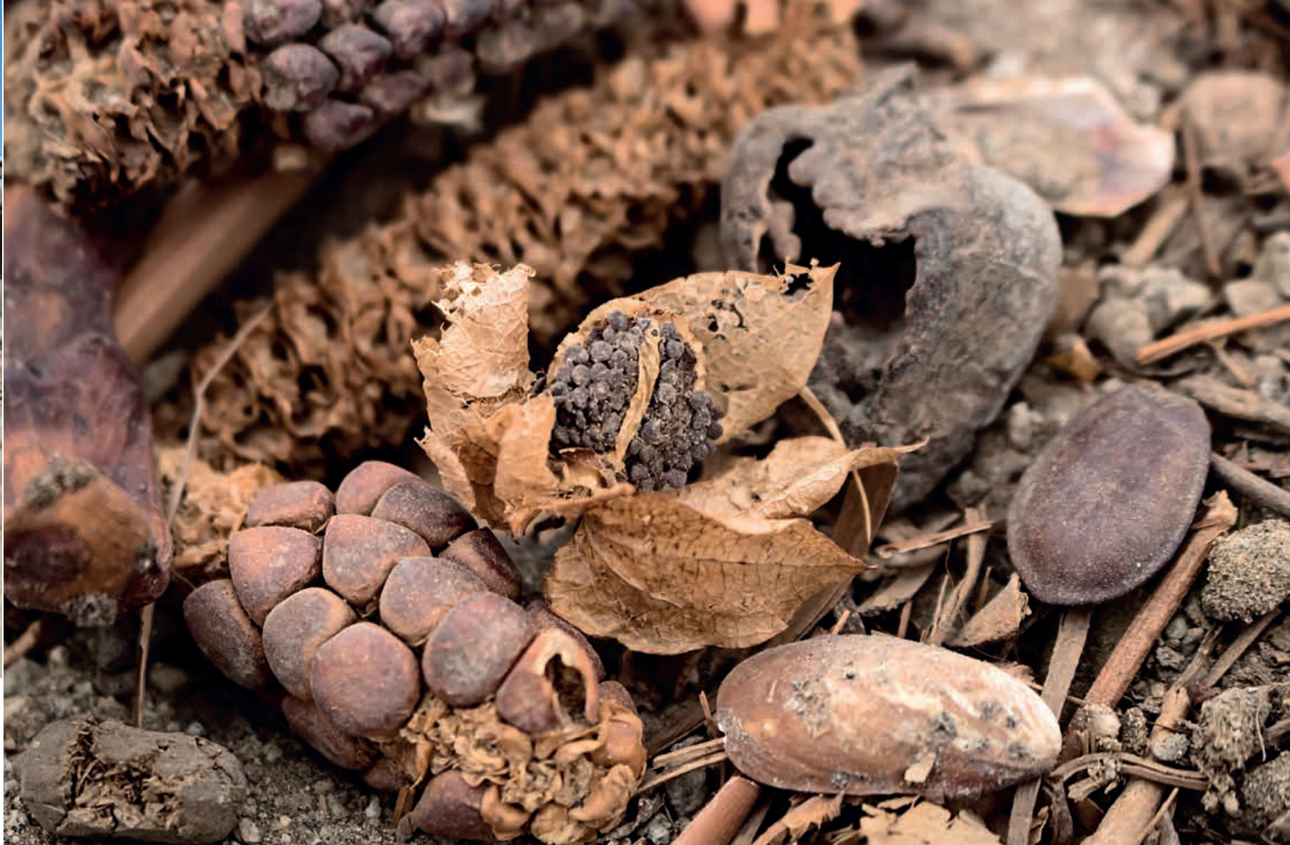
Figura 14. Detalle del contenido de una acumulación de basura de la ocupación inicial, Unidad III del Sector B. Se aprecian especies como Zea mays , Annona muricata , Ipomoea batatas , Persea americana y "frutilla o aguaymanto" en conjunto con coprolitos de camélido.