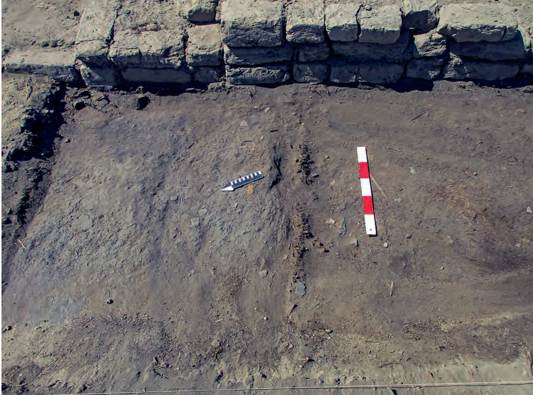
Figura 24. Detalle de la superposición de muros de adobes que conforman el Conjunto 1 sobre los ambientes de quincha de la ocupación doméstica previa. Unidad V del Sector A.