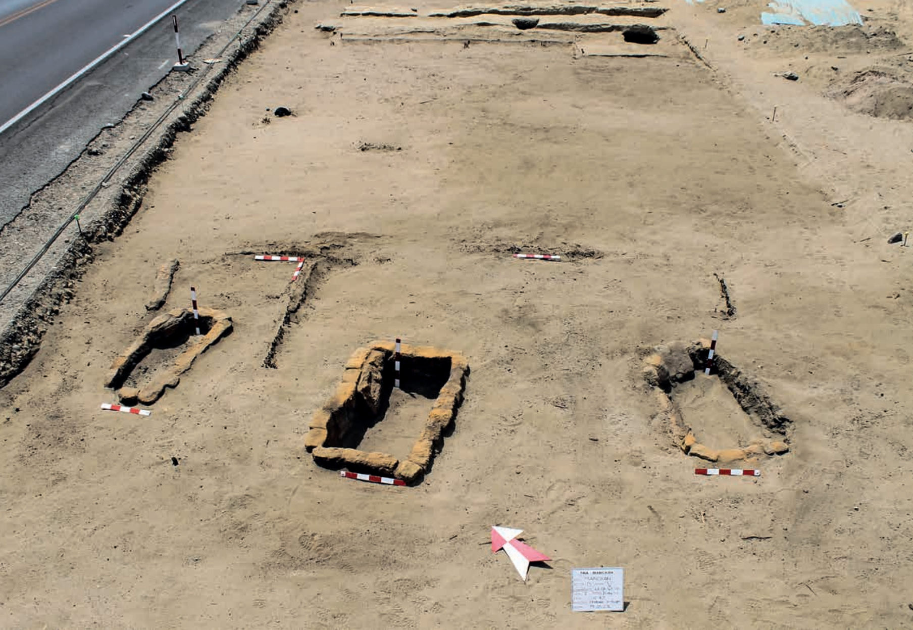
Figura 27. Vista de estructura de combustión y ambientes de quincha al sur del Conjunto 1. Unidad V del Sector B.