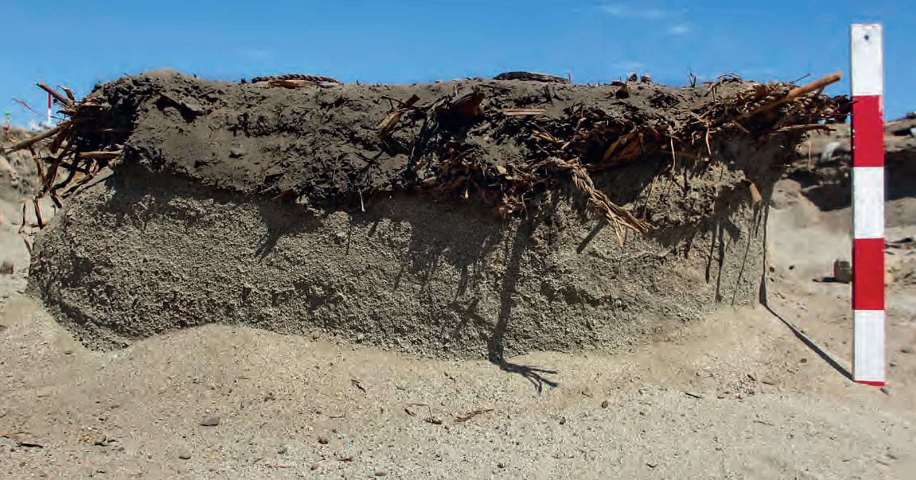
Figura 13. Acumulación de desecho en la Unidad XIII del Sector A, se aprecia su posición intrusiva con respecto a la arena estéril.