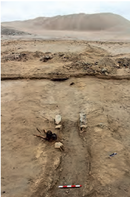
Figura 2. Canal prehispánico registrado en la Unidad III del Sector A, nótese los troncos quemados y piedras que forman su cauce. De fondo, área con arquitectura monumental. Vista de este a oeste.

En sentido este - oeste, 22 m del canal muestran un ancho de cauce estrecho de 0.50 m, solamente en el inicio de los últimos 8 m, las paredes del canal están conformadas por piedras de gran tamaño, colocadas simétricamente a ambos lados; las piedras son de origen granítico, en promedio miden 0.60 m de largo, 0.15 m de espesor y 0.40 m de altura, si bien no presentan huellas de haber sido labradas tienen forma de paralelepípedos irregulares. Posiblemente esta disposición sirvió para regular el flujo y cantidad del agua ya que, a partir de aquí el cauce es más ancho (0.70 m) en los 7 m restantes.