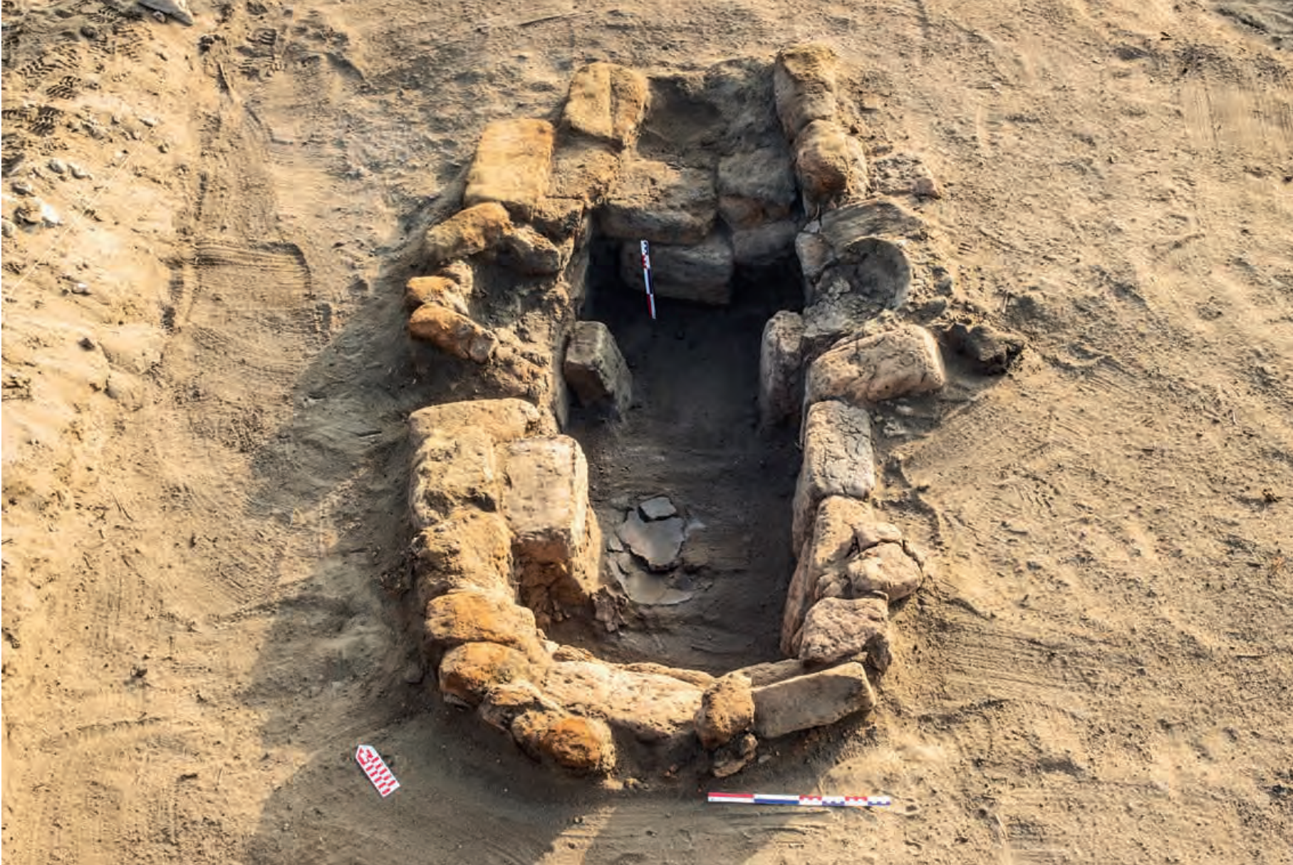
Figura 6. Detalle de la Estructura 1 de la Unidad V del Sector A, resalta su forma y tamaño; tuvo un uso prolongado en el sitio.