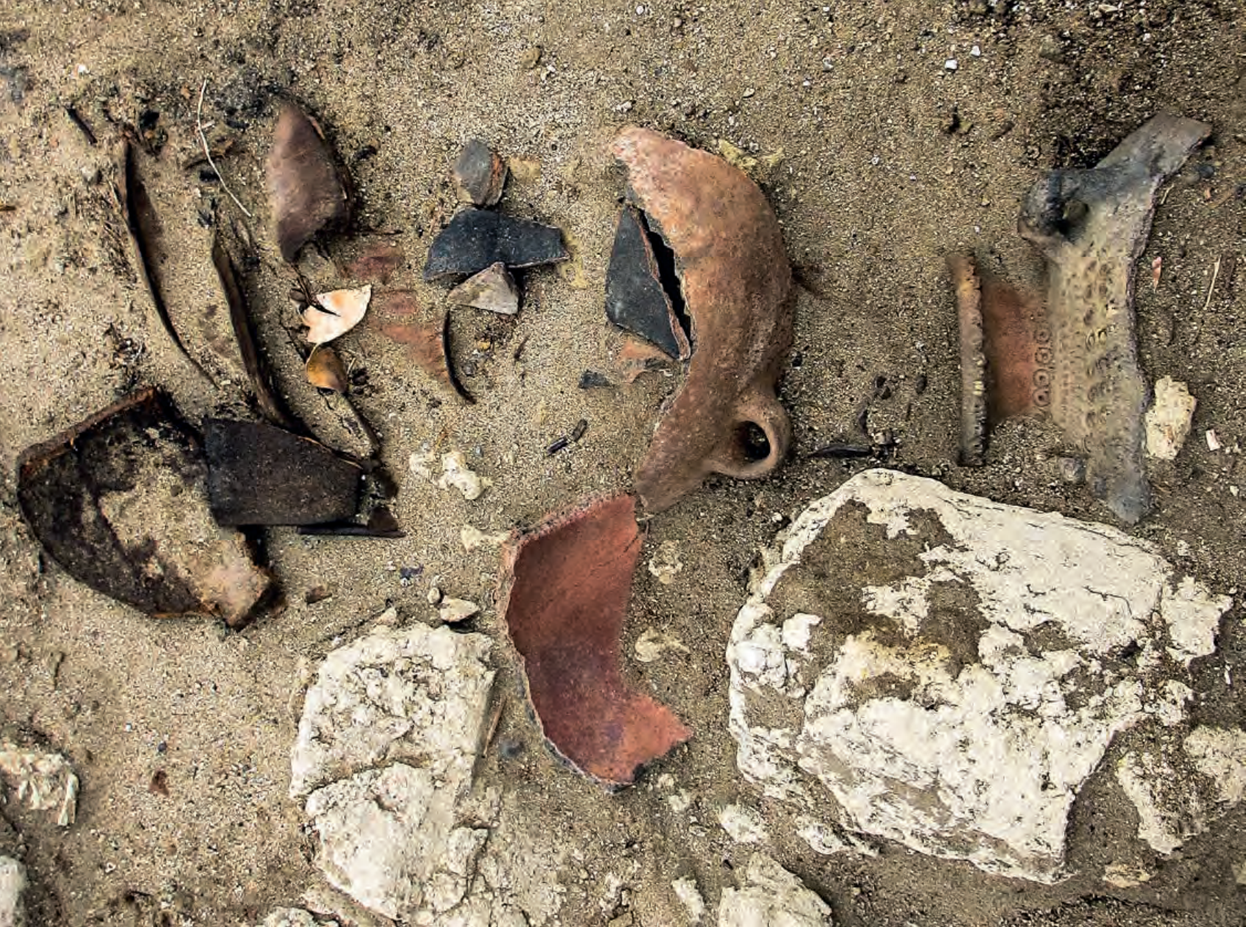
Figura 28. Detalle de fragmentería de cerámica de estilo Casma perteneciente a las evidencias de ocupación inicial.