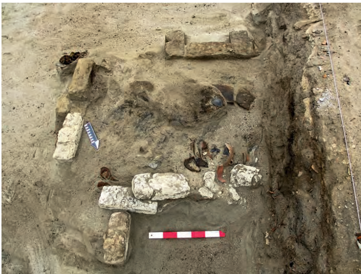
Figura 8. Depósito cuadrangular de la ocupación inicial, conteniendo abundante fragmentería de cerámica de estilo Casma, además de restos macrobotánicos, textiles y ceniza.

Tienen diversas formas y dimensiones, no presentan acceso; los depósitos construidos con adobes tienen forma cuadrangular (Figura 10), son más espaciosos, llegan a medir 1.50 m x 1.50 m, y hasta 1 m de elevación. La mayoría de ellas presentan el interior enlucido. Un depósito en la Unidad VII del Sector B, incluyó un adobe con figuras de peces (Figura 11). Mientras que los depósitos construidos con piedras o piedras y adobes abarcan un área menor, inferiores a 1 m de longitud, tienen forma variable, desde circulares hasta cuadrangulares con esquinas curvas; algunas de las cuales fueron enlucidas con arcilla. Este grupo de depósitos fue desmontado, dejando solamente las bases y los pisos enlucidos; algunos fueron reutilizados como estructuras de combustión, mientras que otros continuaron siendo usados durante la ocupación doméstica posterior.