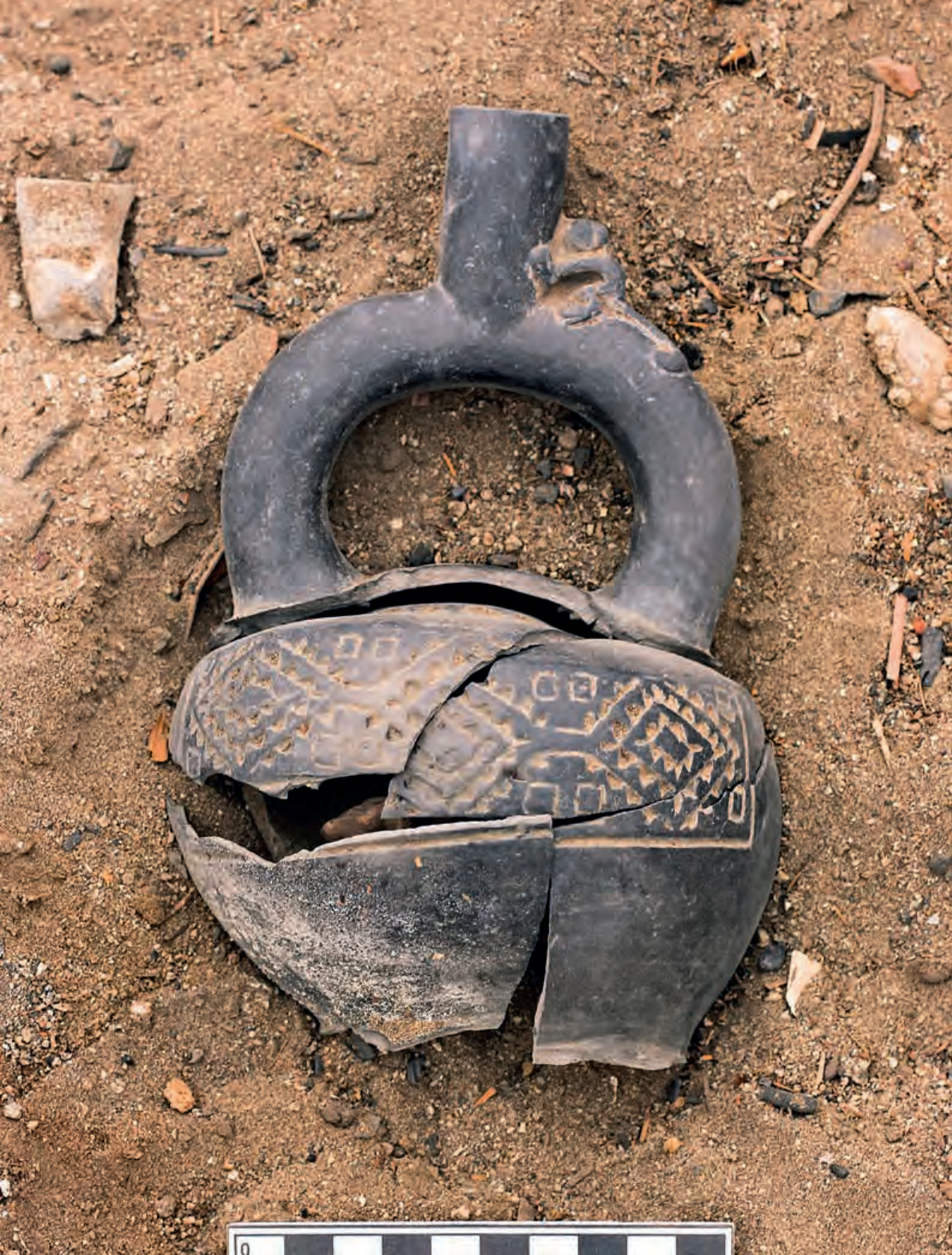
Figura 29. Botella de cerámica con asa estribo Chimú, registrado en uno de los rellenos constructivos de la Unidad V del Sector B.