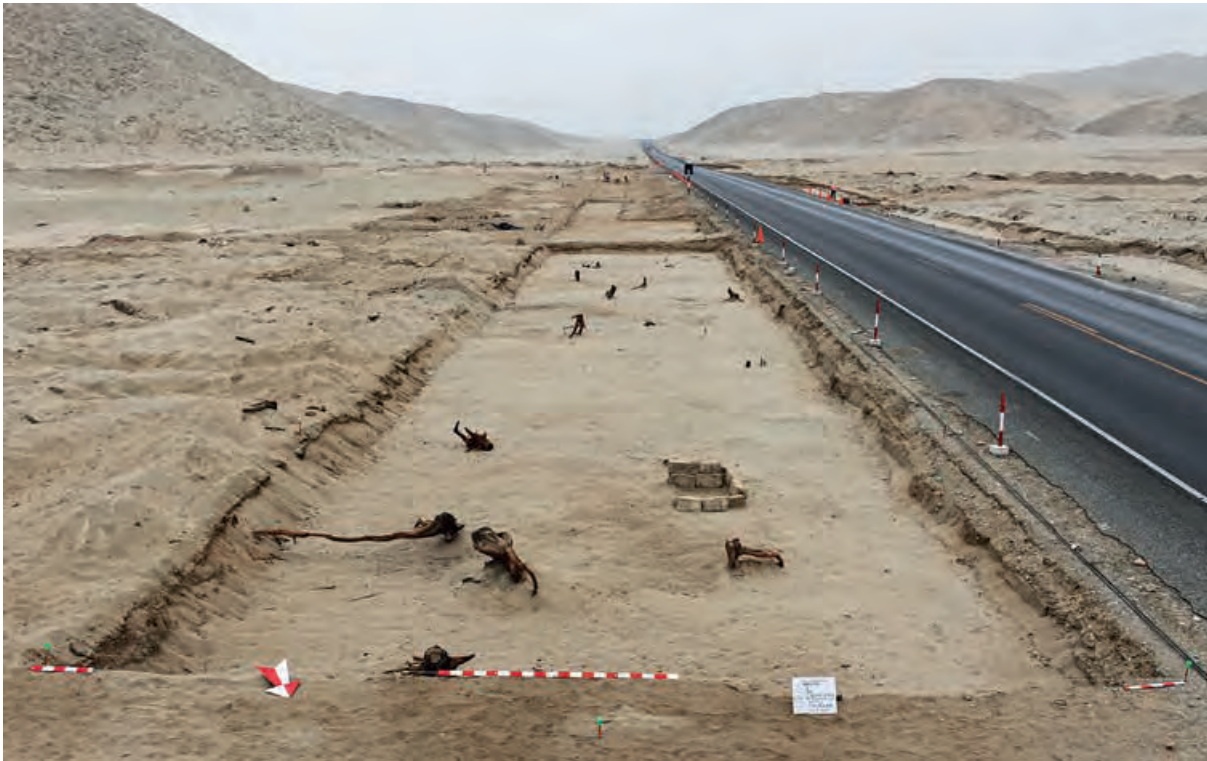
Figura 4. Troncos quemados en la Unidad VII del Sector B, evidencian la existencia de un bosque previa al inicio de la ocupación en Manchán, se aprecia un depósito de la ocupación inicial.

El total de los troncos y raíces de árboles se encontraron carbonizados, por lo que fueron talados usando fuego; incluso, como indicamos, los que crecían al costado del canal. La actividad de rozo efectuada, parece haber sido parte de un solo evento, lo cual implicó la apertura de áreas nuevas de terreno, de ahí que consisten en evidencia de ocupación inicial.