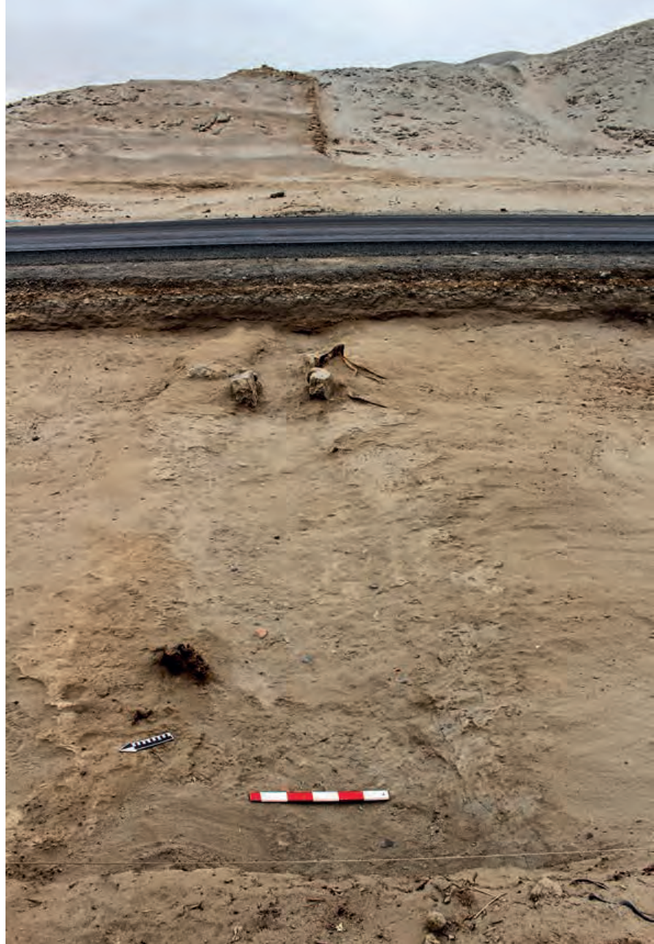
Figura 3. Canal prehispánico registrado en la Unidad III del Sector A, construido excavando en la arena estéril, se proyecta tanto al este como al oeste. Al fondo, arquitectura del Conjunto 1. Vista de oeste a este.

Con los datos obtenidos se pudo calcular que la pendiente del canal fue de 0.1% (disminuye 1 m cada kilómetro), tuvo un caudal de 0.0528 \text{ m}^3/\text{s} (aproximadamente 50 litros por segundo) y su flujo tuvo una velocidad de 0.5661 \text{ m/s} .