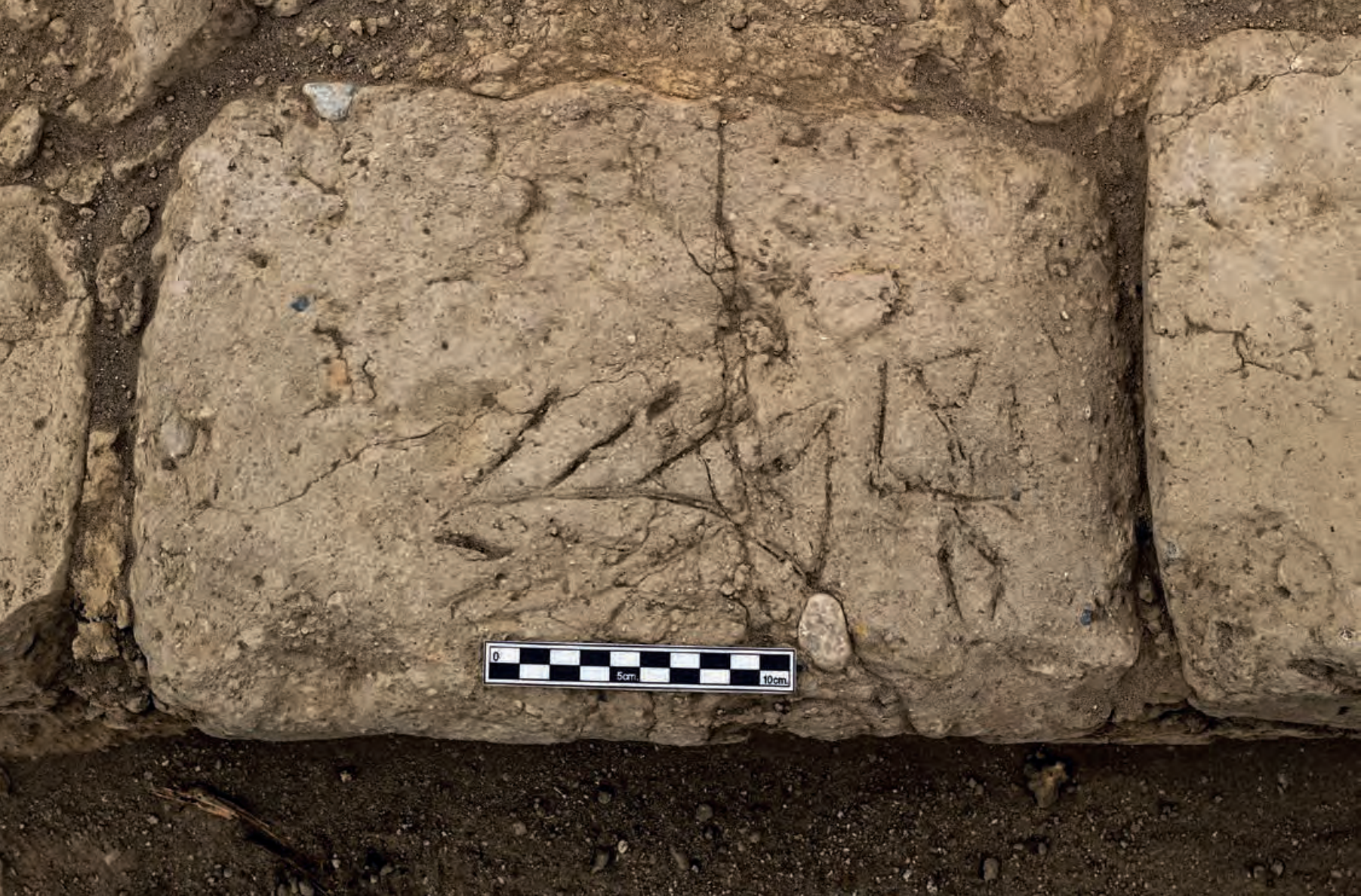
Figura 25. Detalle de adobe perteneciente a muro del Conjunto 1, se aprecia la representación de un pez y un ave en vuelo descendente. Unidad III del Sector A.