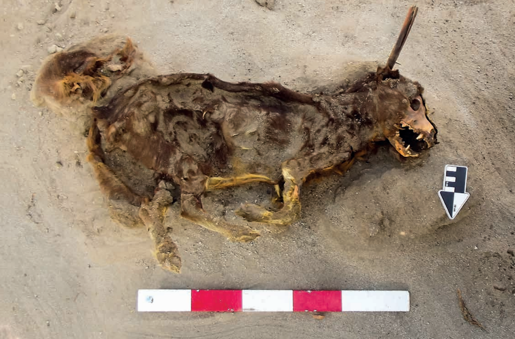
Figura 19. Entierro de cánido durante la ocupación inicial, dado el buen estado de conservación se aprecia el color del pelaje.