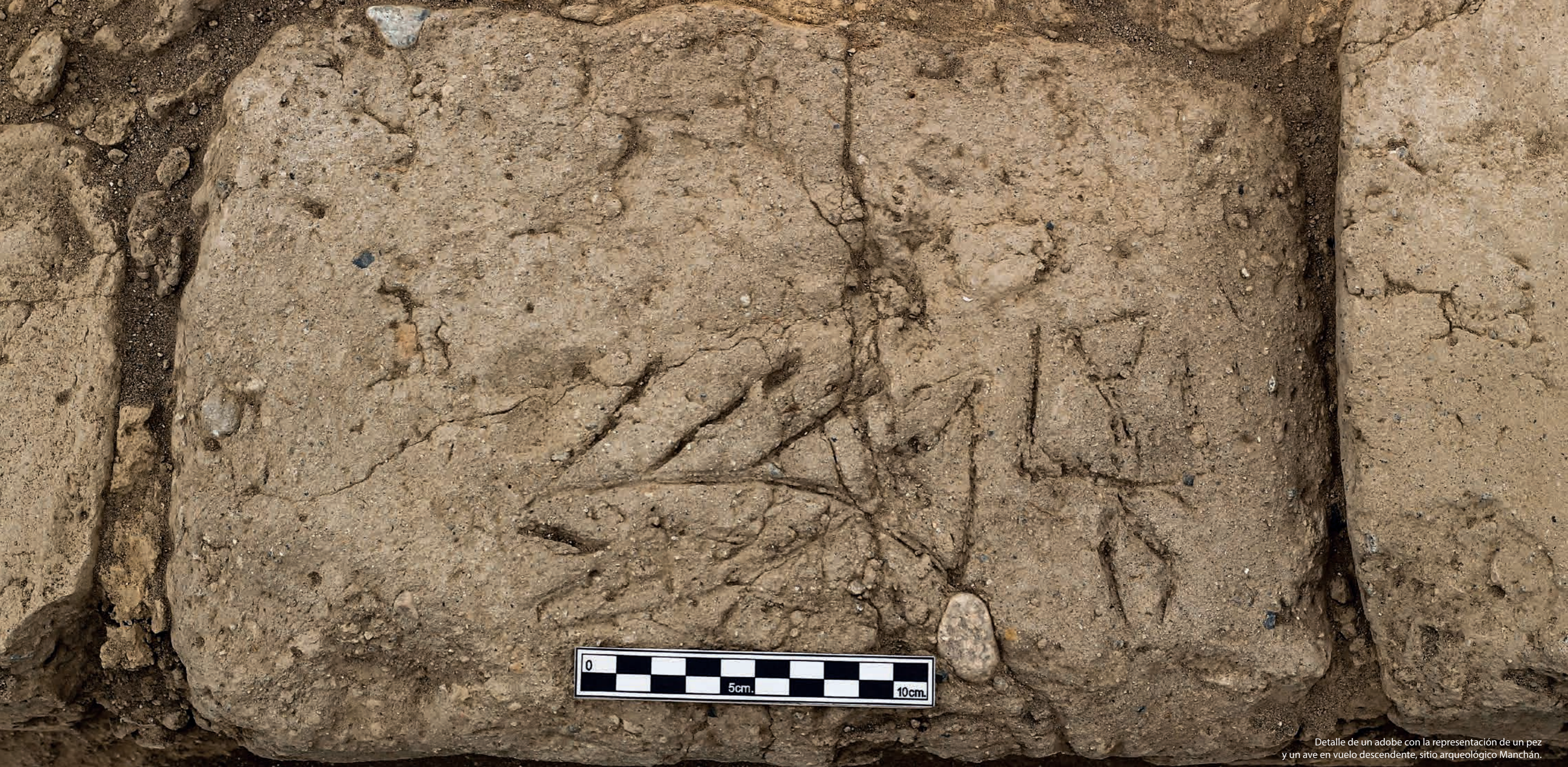
Detalle de un adobe con la representación de un pez y un ave en vuelo descendente, sitio arqueológico Manchán.