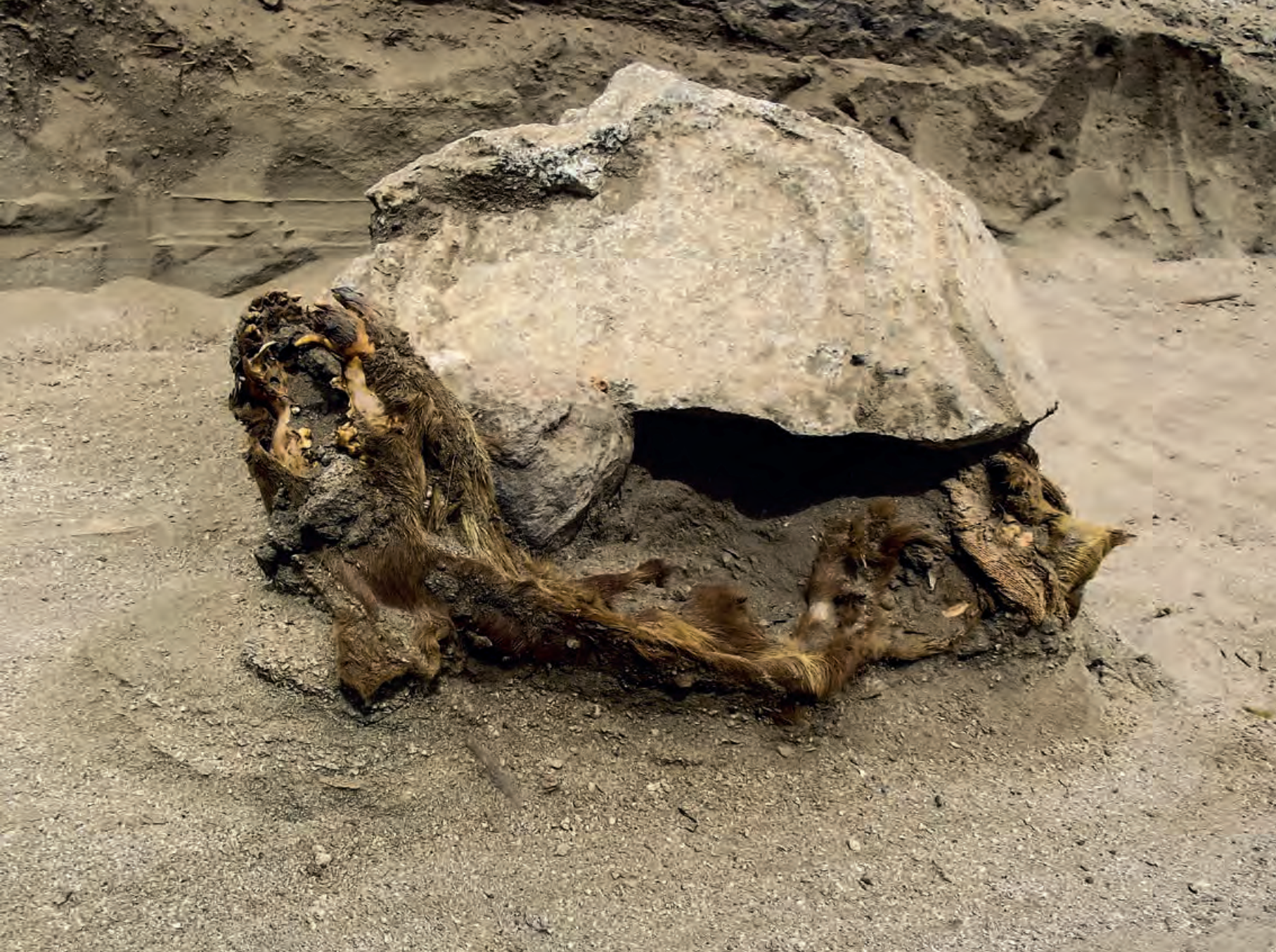
Figura 18. Entierro de cánido sobre la arena, encima del individuo se colocó una pesada piedra, posiblemente cuando aún estaba con vida.