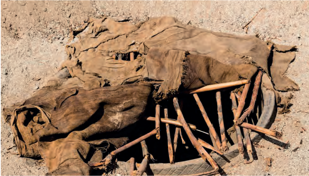
Figura 12. Tinaja enterrada en la arena estéril, Unidad IX del Sector A. Fue cubierta por un textil llano teniendo como soporte cañas entrecruzadas.

Indistintamente enterrados en la arena estéril, en varios puntos de las unidades se recuperaron vasijas de cerámica, algunas de grandes dimensiones, como tinajas, con un alto volumen de almacenaje para líquidos (Figura 12), vasijas más pequeñas, como ollas, fueron colocadas boca abajo y en posición boca arriba, al igual que lagenarias o mates completos.