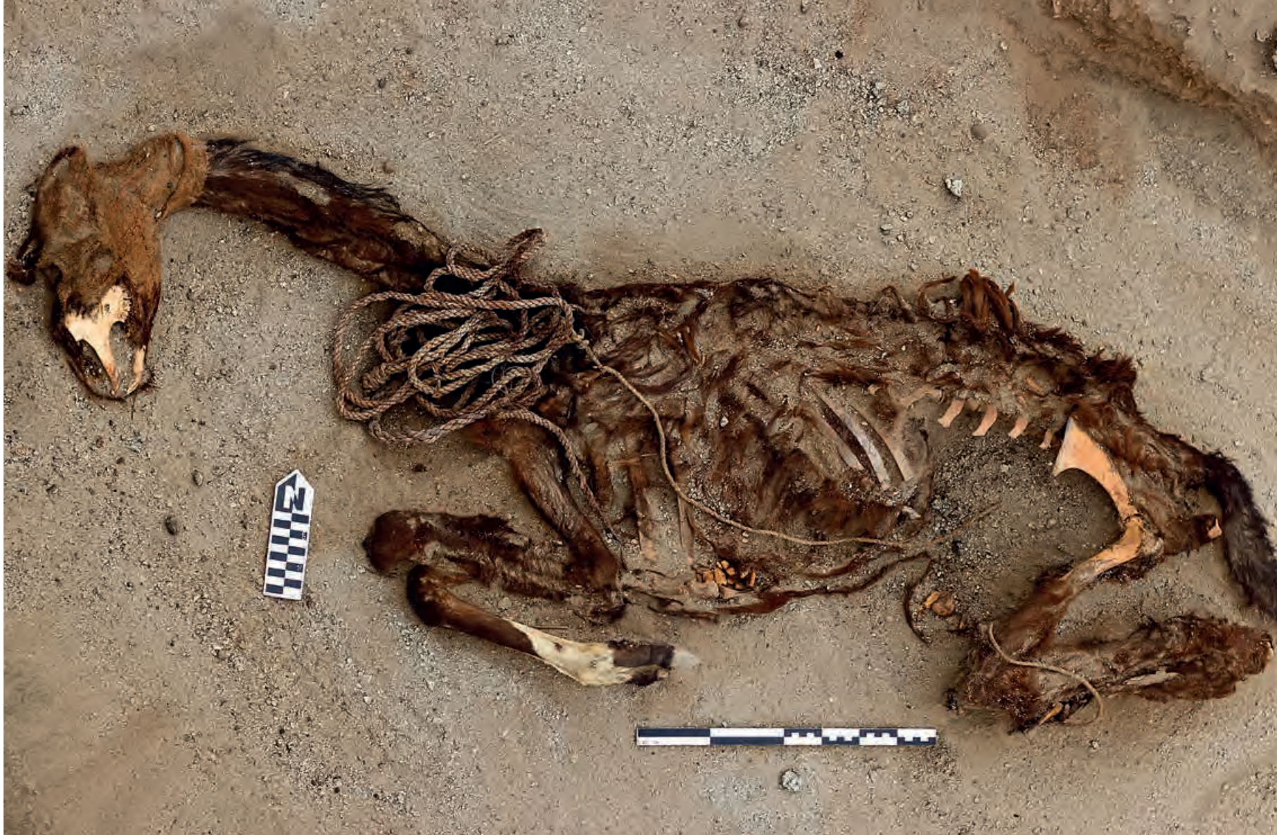
Figura 20. Entierro de camélido proveniente de la Unidad X del Sector B, nótese su posición, los textiles y cuerda asociados.