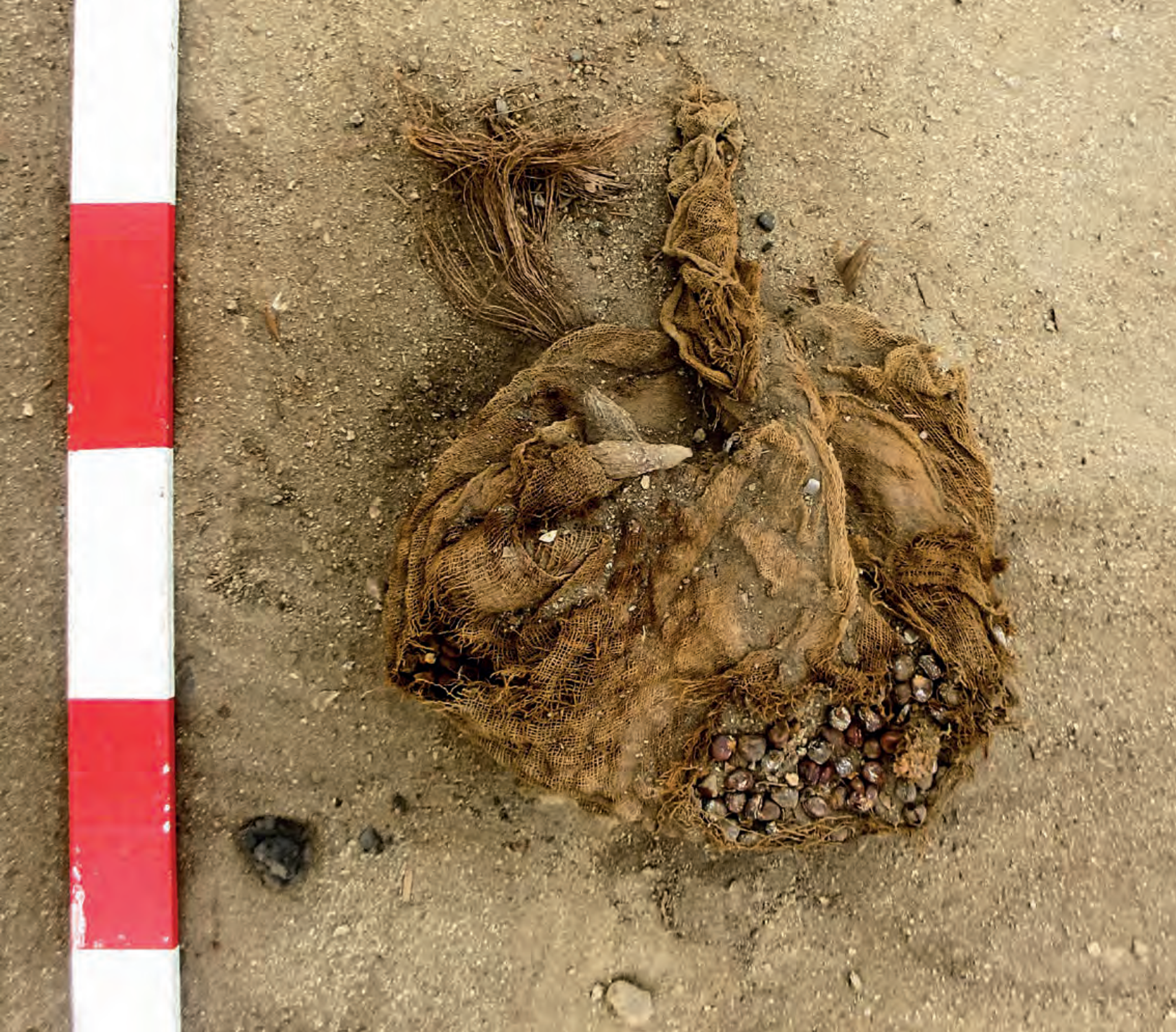
Figura 23. Detalle de envoltorio textil recuperado de la capa de actividad doméstica, contiene maíz desgranado. Posiblemente usado para guardar semillas.