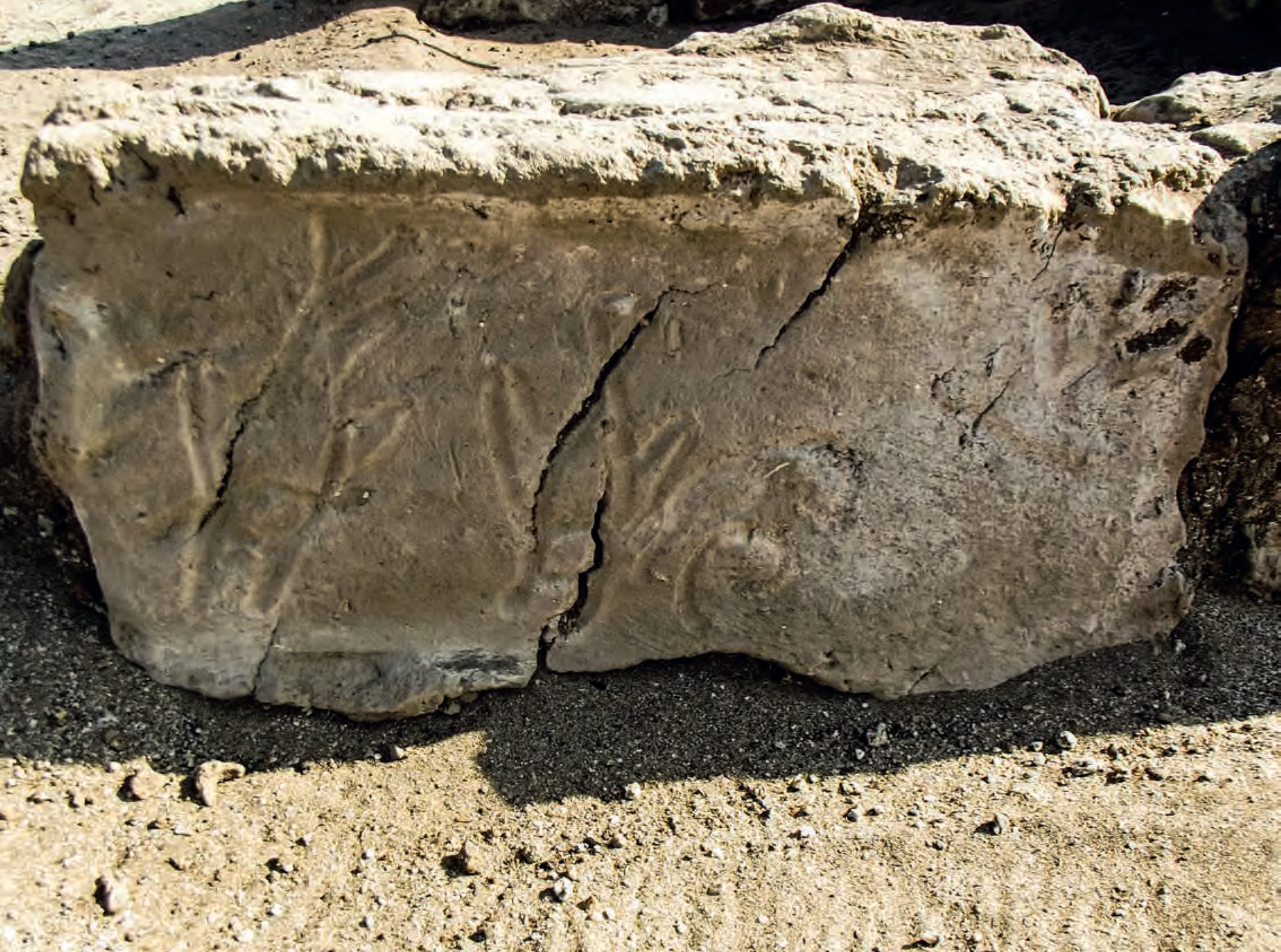
Figura 11. Vista en detalle de peces dibujados en un adobe del Depósito 5, Unidad VII del Sector B, se realizó cuando la mezcla estaba aún fresca.