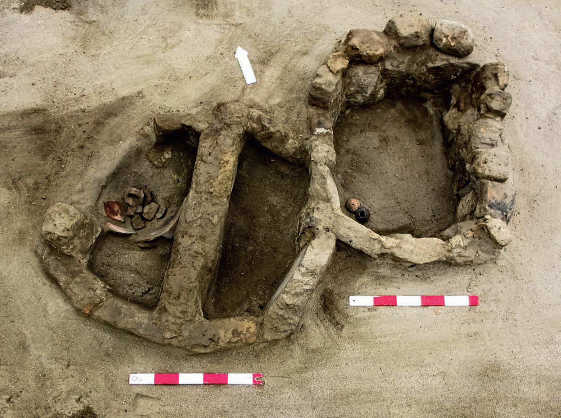
Figura 9. Depósitos circulares, uno con división interna, teniendo piso enlucido con arcilla. Contuvieron fragmentería de cerámica y 2 "trompitos" de estilo Casma.