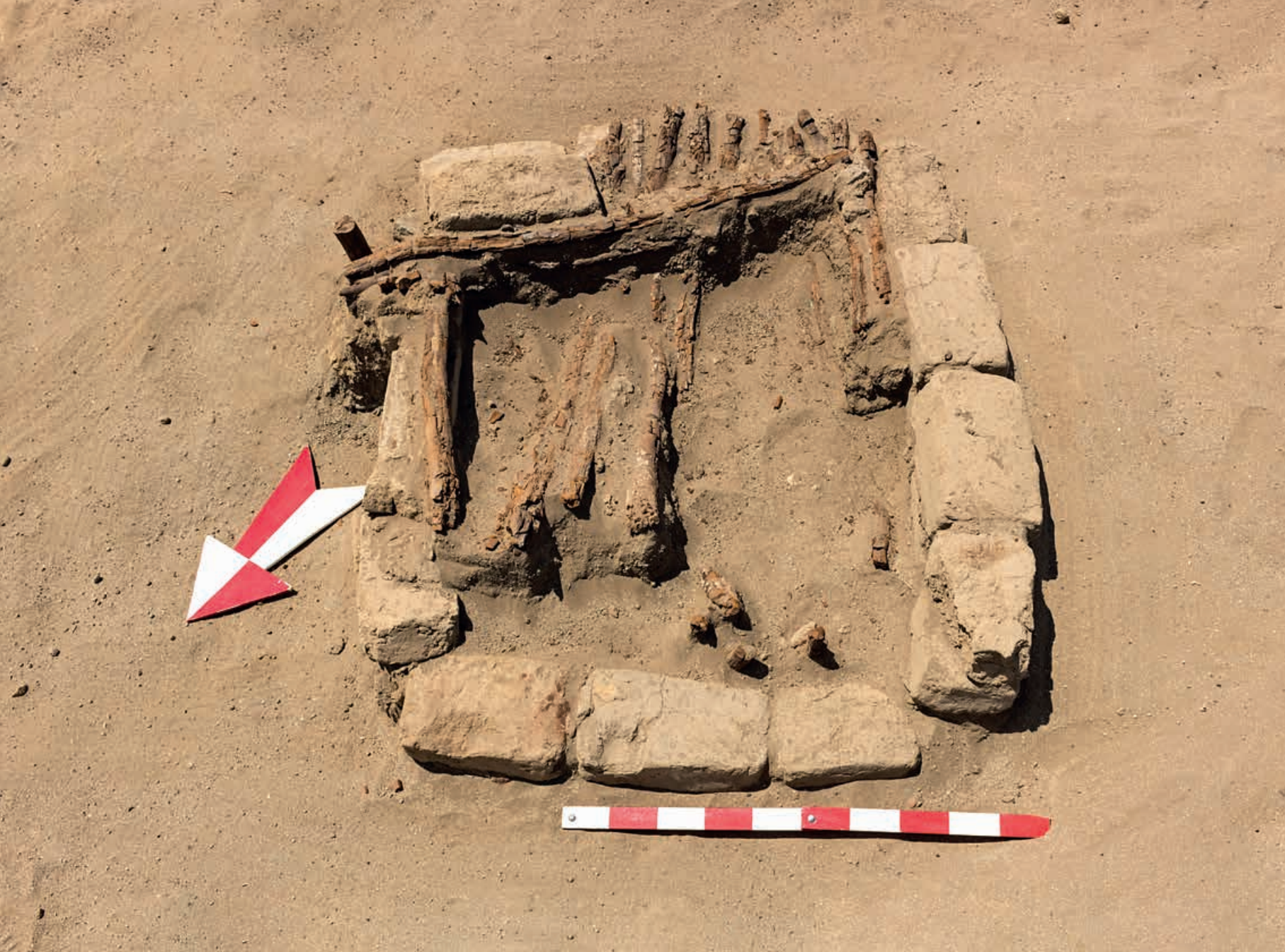
Figura 10. Depósito 5, registrado en la Unidad I del Sector A, presenta travesaños de madera que sirvieron como cubierta.