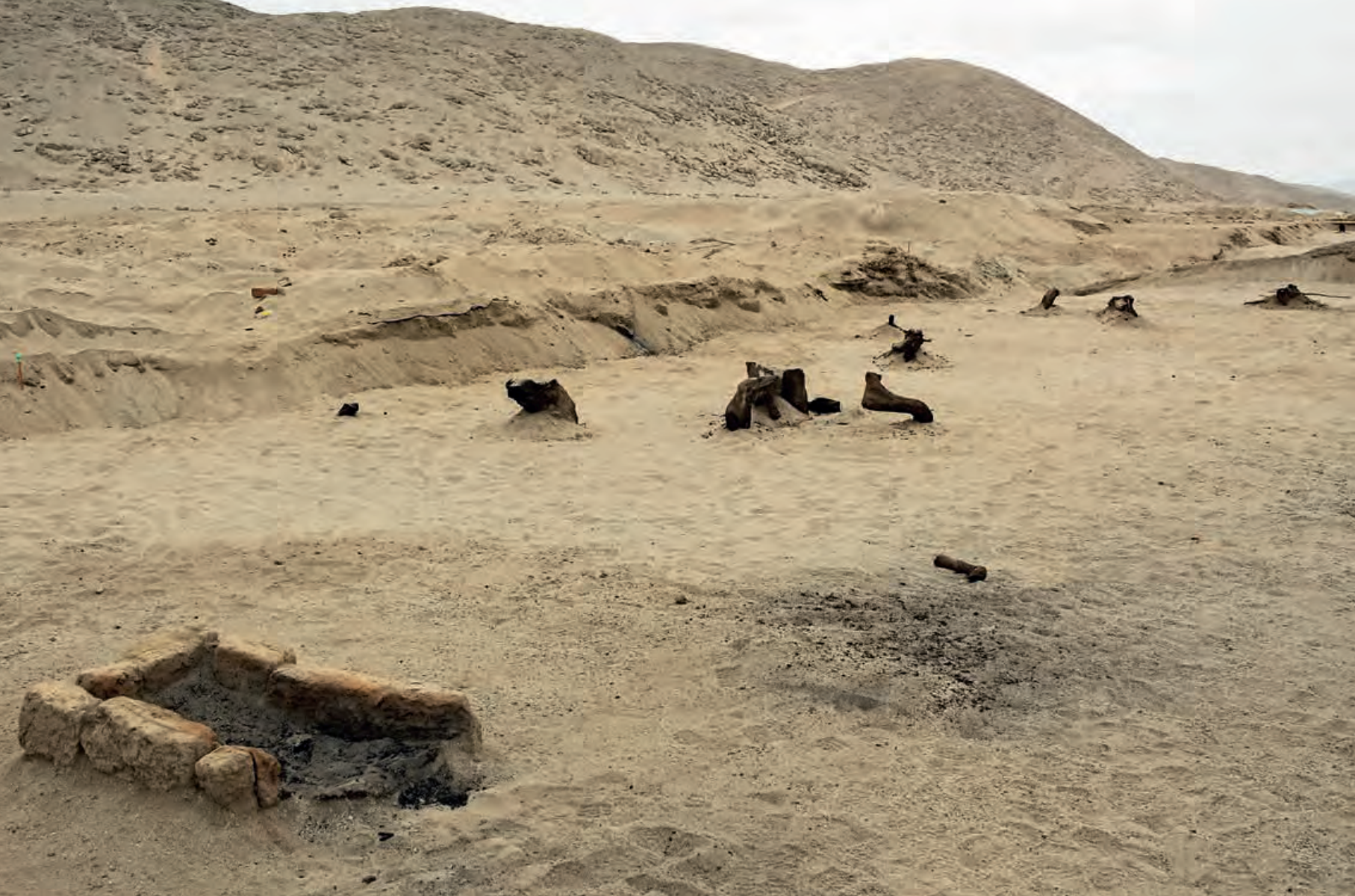
Figura 7. Estructura de combustión cercana a un grupo de troncos quemados en la Unidad III del Sector B, demuestra que su ubicación se debe al fácil acceso de madera recientemente obtenida.