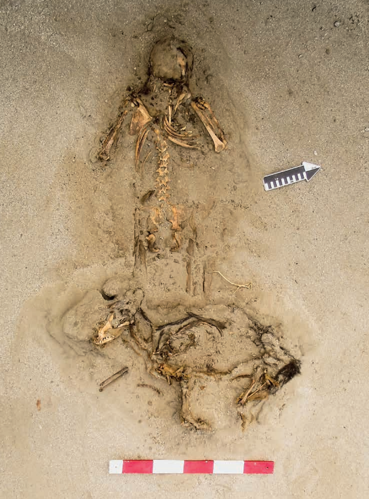
Figura 17. Contexto funerario 20 de la Unidad XV del Sector A, en posición decúbito ventral extendido con las extremidades superiores flexionadas; presenta el cuerpo completo de un perro colocado sobre sus extremidades inferiores.