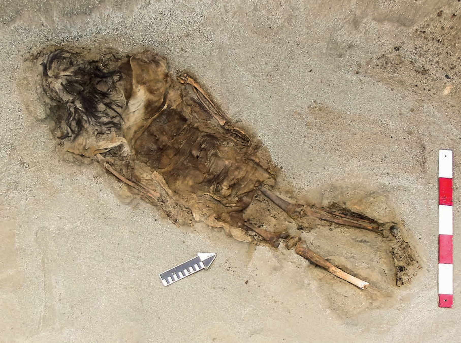
Figura 15. Vista del Contexto Funerario 7 de la Unidad XV del Sector A. Individuo en posición decúbiteo ventral extendido, con las extremidades inferiores elevadas.