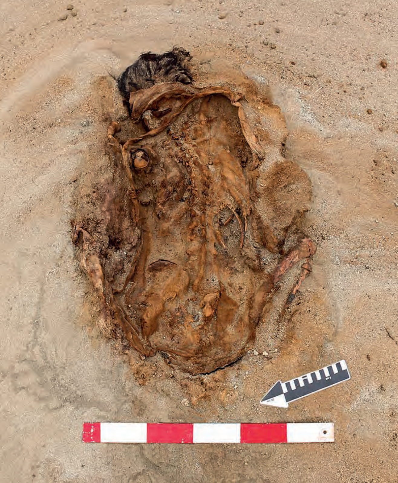
Figura 16. Vista del Contexto Funerario 1 de la Unidad VIII del Sector A. Individuo en posición decúbiteo ventral flexionado.