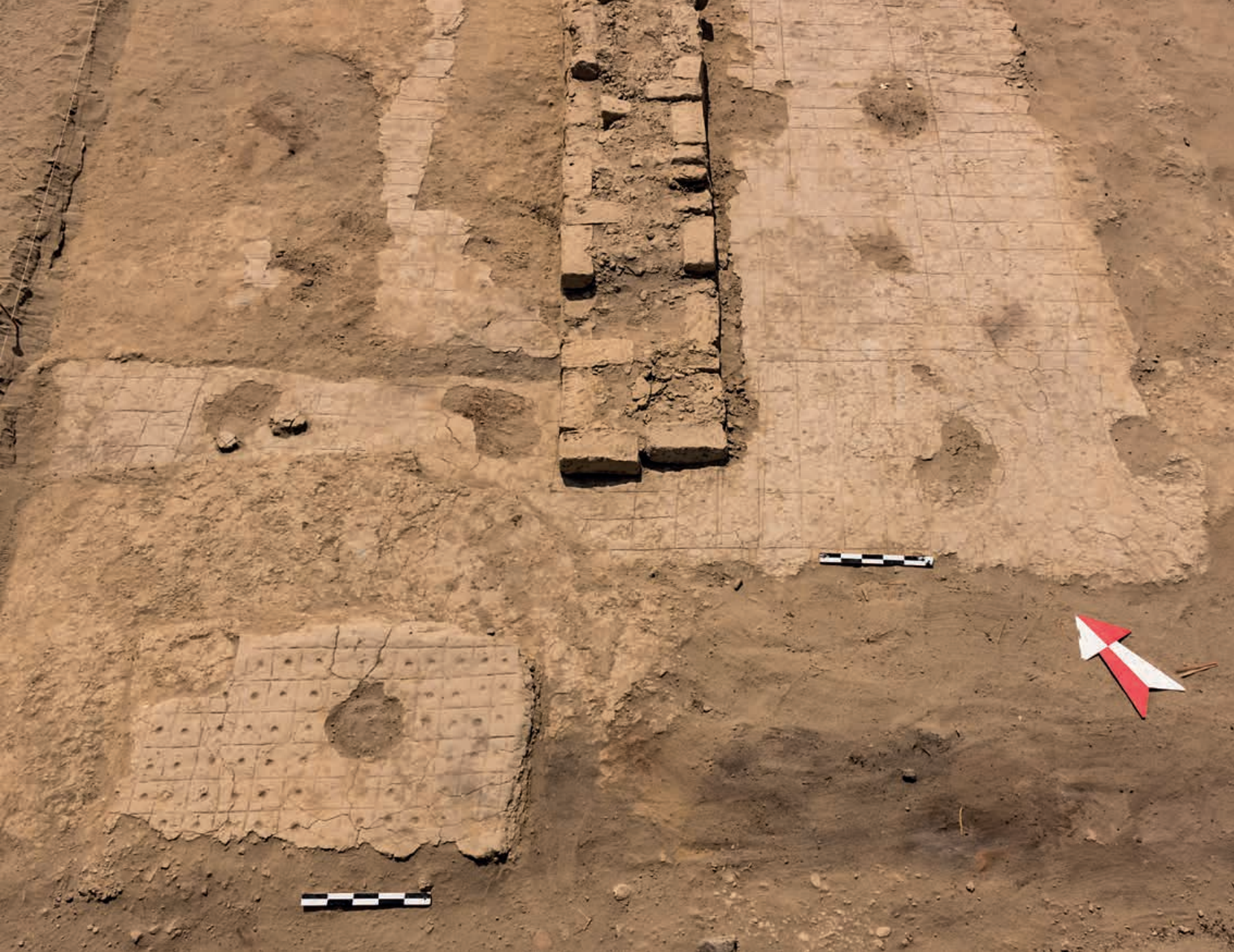
Figura 26. Vista del piso de filiación Inca registrado en la Unidad IV del Sector A, se aprecia el diseño reticulado con concavidades en cada recuadro, asociado a muro que conforma el Conjunto 1.