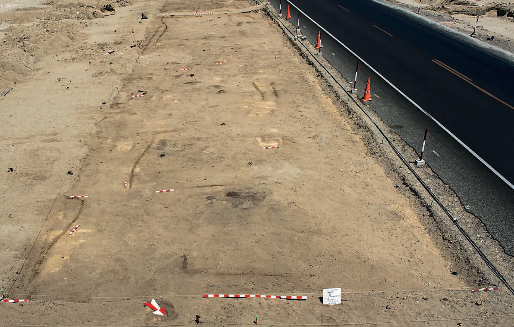
Figura 22. Vista de la capa con evidencias de intensa actividad doméstica en la Unidad VII del Sector B, las líneas más oscuras corresponden a bases de ambientes de quincha.